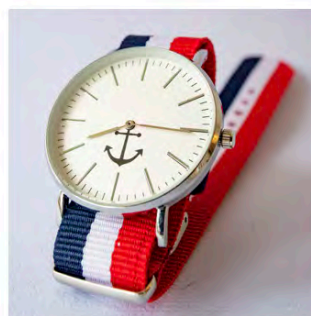
Standard Sailing LIMITED EDITION