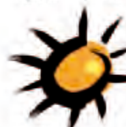
Café Solberg Vägen ut! kooperativen

KARINS DÖTTRAR – väv- och hantverkskooperativ med arbetsträningsplatser för kvinnor.