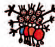
Karins Döttrar Vägen ut! kooperativen

VILLA VÄGEN UT! KARIN – halvvägshus för kvinnor. För våldsutsatt kvinna kan vi även erbjuda jourplats.