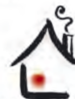
Villa Vägen ut! Vägen ut! kooperativen

VILLA VÄGEN UT! SOLBERG – halvvägshus för män. Snart öppnar Villa Vägen ut! även i Sundsvall och Örebro.