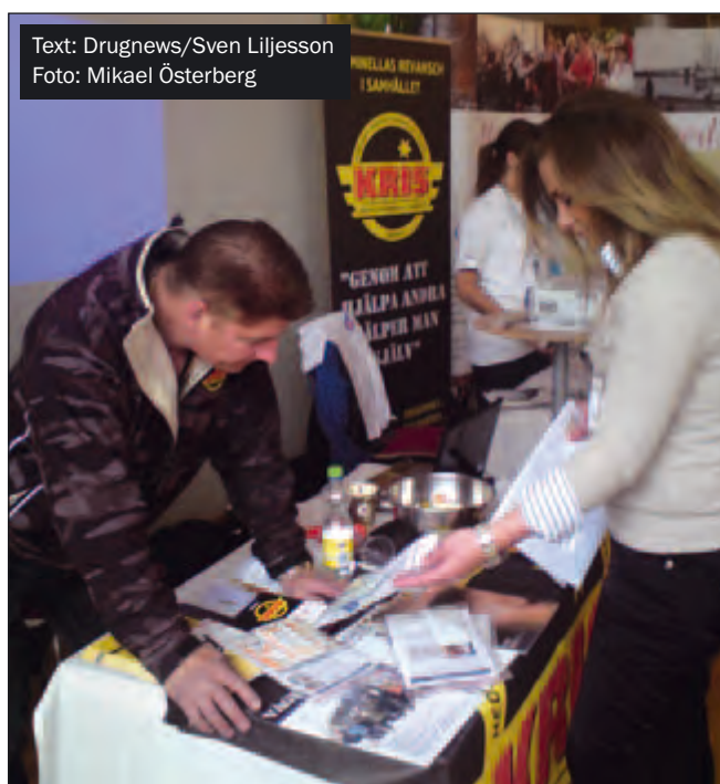
Text: Drugnews/Sven Liljesson

I arrangörsguppen för mässan har omstyrningen och breddningen stöd av Folkhälsoinstitutet.